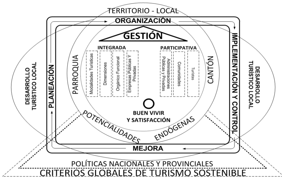
Figura 1. Concepción preliminar de un modelo gestión turística integrada y participativa.

La sistematización de los preceptos anteriores permite la modelación de la concepción preliminar sobre un modelo de gestión turística integrada y participativa.